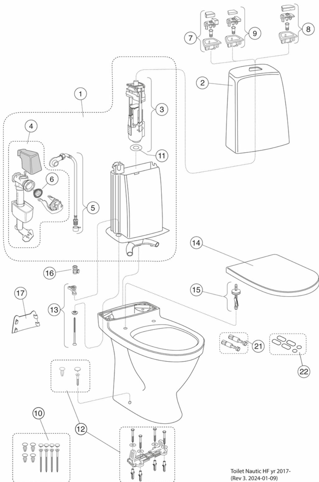
Toilet Nautic HF yr 2017- (Rev 3. 2024-01-09)