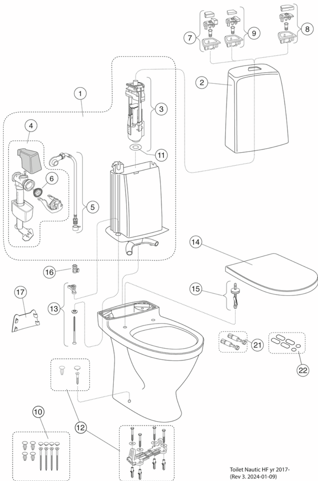
Toilet Nautic HF yr 2017- (Rev 3. 2024-01-09)