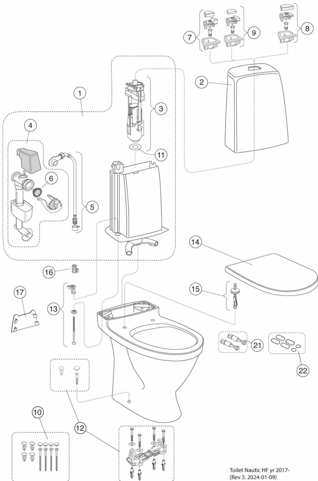
Toilet Nautic HF yr 2017- (Rev 3. 2024-01-09)